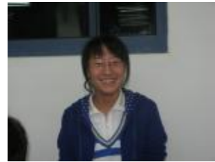
文化部部长: 孙畅 寄语:永不言弃!