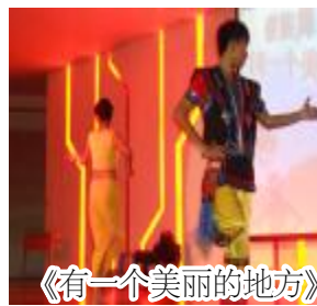
《有一个美丽的地方》

傣族是一个古老而神秘的民族,它蕴含无尽的美。而它的最美的部分就是傣族舞蹈,它总会给人带来几多欢喜,几多向往。