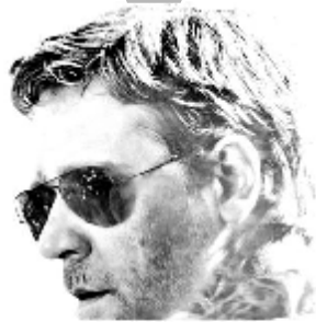
РАССЕЛЛ КРОУ ТРИ ДНЯ НА ПОБЕГ ВСЕ РАДИ НЕЕ